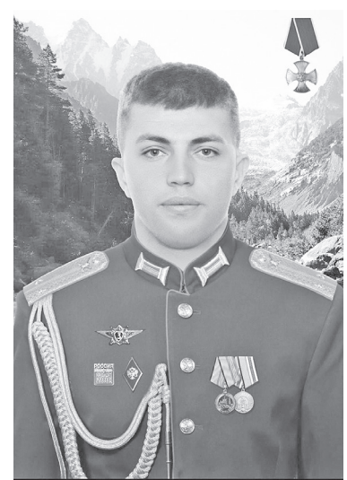
Атагд кодта уонгастæй йæ фыртмæ, Знагæн дæр уый ма бауарзæд цæст, Бакасти йæ зæрдиаджы уындмæ Сæвдылдта йæ сау мæримæ хæст

Фæлæ бирæ н 'ахаста йæ цинаг, Номхыгд æм æрбахастой æндæр. Фыст дзы уыд йæ зæрдиаг, йæ уидаг. Уыцы уысм ыл дуне дæр ныттар.